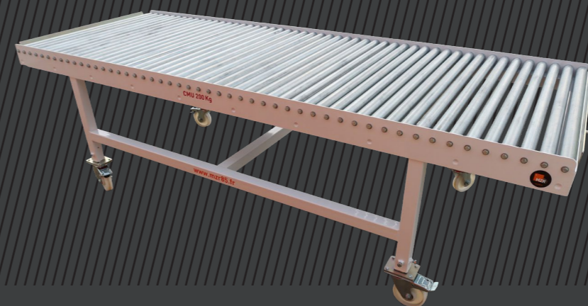
Convoyeur à rouleaux